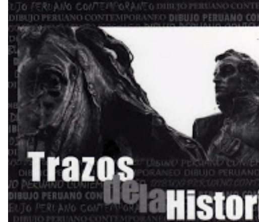
Libro de arte peruano contemporáneo.